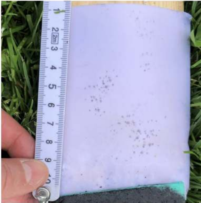
Afbeelding 3.2 wezelsporen

Er zijn geen exemplaren van marterachtigen (bunzing, wezel en hermelijn) waargenomen in het projectgebied. Wel zijn sporen van een wezel in een sporenbuis aangetroffen (Afb. 3.2).